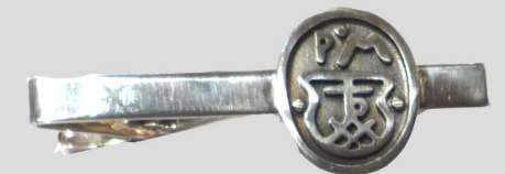
Slipsnål 100 €

Smyckes serie i silver, baserad på Petrus sigill.